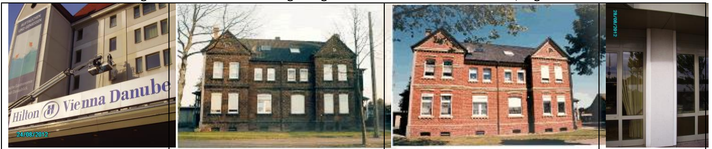
Bild links: Reinigung der Fassade vom Hilton; Mittig Villa vorher und nachher; Bild rechts: Säule – vor und im unteren Bereich nach der Reinigung.

Wir reinigen Fassaden, bessern Fehler aus, Streichen dort wo nötig neu und Sanieren Gesimse. Egal ob Naturstein oder Metall, Klinker oder Kunststein – wir reinigen entweder mit Hochdruck-Dampfreiniger oder mit einem Schon-Sandstrahlgerät und entfernen Ablagerungen wie Ruß und Umweltschmutz, Algen und Moose.