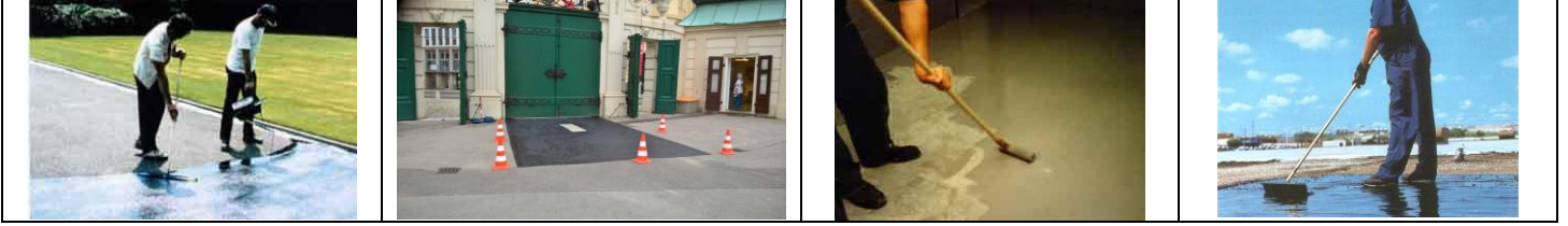
Links: Beschichtung von Gehwegen im Park; Mittig: Ausbessern von Betonböden und Neubeschichtung.

Wir reparieren Löcher in Böden und beschichten diese neu – entweder mit Epoxidharz oder Polyurethan (für Innenbereiche), wir reparieren Betonböden und wir beschichten Asphaltböden und verfüllen Löcher und Risse. Dadurch sind solche Böden im Außenbereich vor Frostschäden geschützt und halten länger. Wir behandeln Estrichböden und machen diese dadurch 5 x so hart wie ohne Behandlung und daher staubfrei. Fällt dann ein Hammer runter ist der Hammer kaputt ;-) Auf Wunsch können wir auch Estriche nachträglich einfärben.