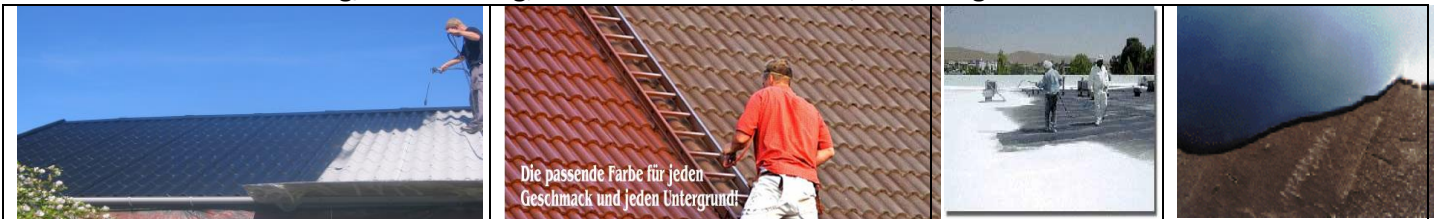
Links: Beschichtung von einem Eternit-Dach; mittig: Ziegeldach-Anstrich; Industriedach in weiß (Sonne-reflektierend) bzw. mit Flüssigfolie abgedichtet

Wir reinigen Dächer, dichten eventuelle Löcher nach Hagelschäden, beschichten neu mit Farbe (inkl. Dichtstoffen). Und wir sanieren fasernde Eternit-Dächer damit Asbest-Fasern nicht länger in die Luft kommen. Sie sparen die teure Entsorgung von Eternit als Sondermüll und das Neu-Eindecken. Flachdächer beschichten wir entweder mit einer flüssigen Folie (Bitumen oder Betondächer) oder – mit Farbe. In jedem Fall wird das Dach wie neu und hält garantiert noch weitere 10 Jahre.