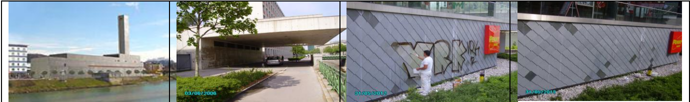
Das Heizwerk in Salzburg, die Noever Terrasse am MAK, zig Schulen, Denkmäler, die Urania, Geschäfte und Wohnhäuser, die TU und andere Unis wurden von uns von Graffiti befreit und gegen neue geschützt.

Wir haben für jede Oberfläche einen optimalen Graffitischutz. Egal ob WDVS wo wir mit einer Graffitschutzfarbe überstreichen) Beton oder Naturstein wo wir farblos, unsichtbar und dauerhaft schützen. Egal ob Klinker, Sandstein oder Putz – es gibt für jede Fassade genau eine optimale Lösung. Und wir haben diesen. Unser Graffitischutz ist unsichtbar, glänzt nicht und hält lange – wenn Mikrowachs und Konsorten längst abgewaschen sind.