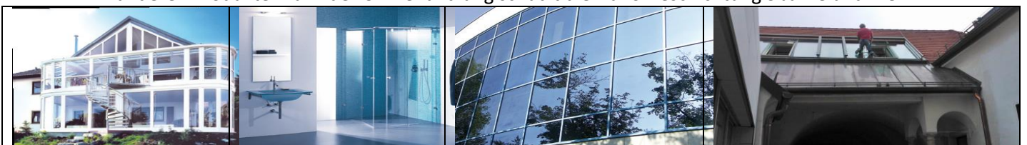
Glasversiegelung eignet sich für Wintergärten, Duschen, Dachfenster und Gewerbebauten und ...

Die Nano-Versiegelung wird noch extra mit einer UV Lampe eingebrannt. Dadurch hält der Schutz länger als alle anderen Produkte. Dank der UV Behandlung schützt die Nano-Beschichtung 3 Jahre und mehr.